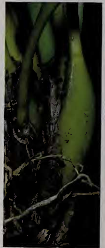
Fig. 4 : pseudobulbe de H. ventricosa

Cette espèce rappelle également H. sessilis (O.Swartz) F.Barros et s'en distingue par des pseudobulbes plus grands (5,5 cm versus jusqu'à 3,5 cm), un pédoncule nettement plus long (3,4 cm versus 1 cm) et des fleurs de couleurs différentes (orange ponctué de pourpre versus jaune verdâtre à marron ponctué de pourpre).